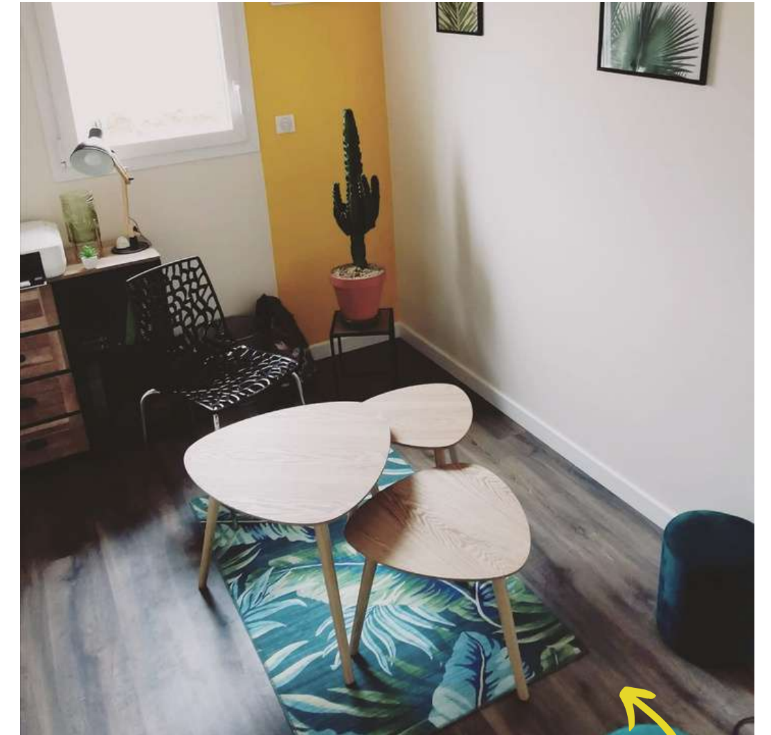
CABINET DIETETIQUE & HYPNOTHÉRAPIE