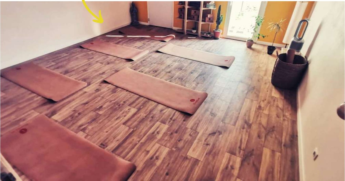
SALLE JAUNE PILATES, YOGA, ETIREMENT & MEDITATION