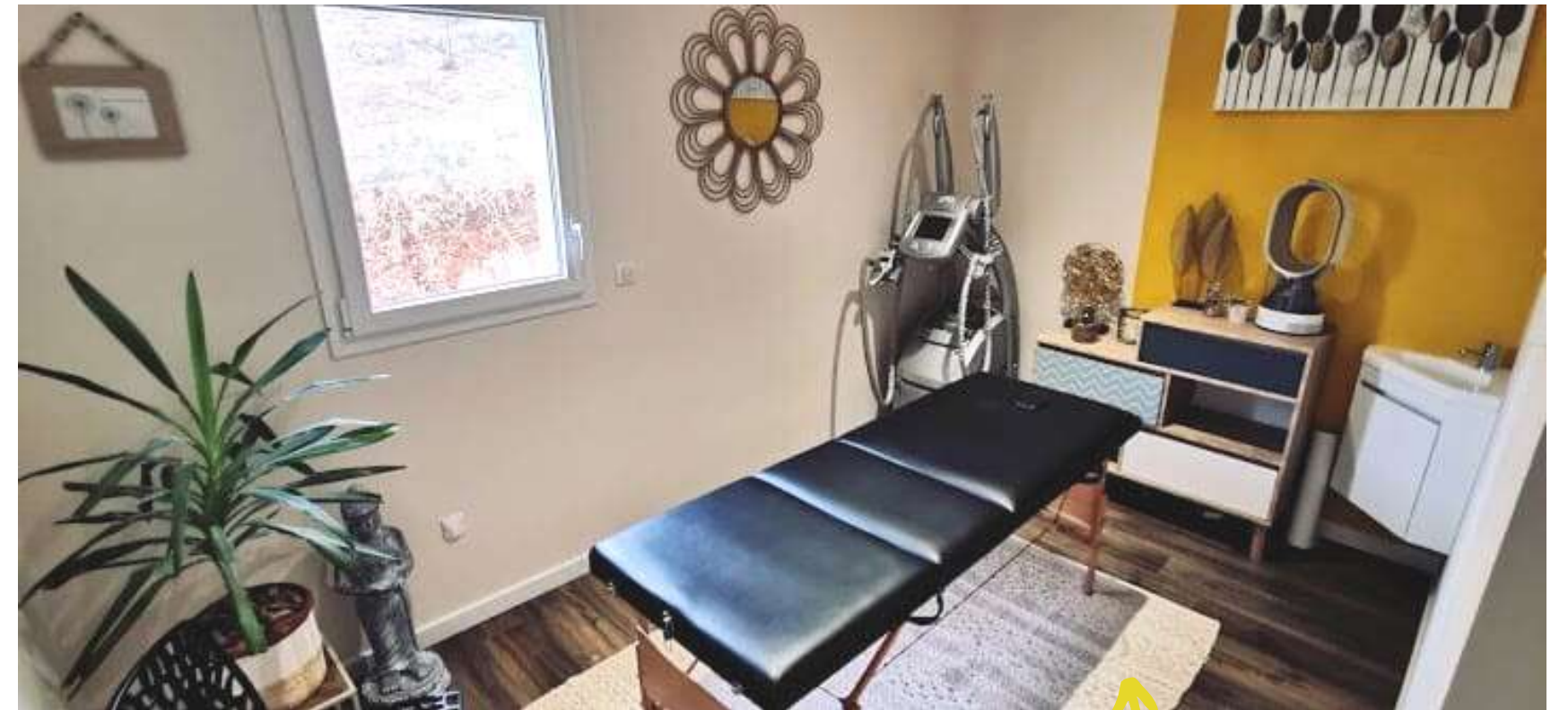
SALLE LPG, MASSAGE & REFLEXOLOGIE