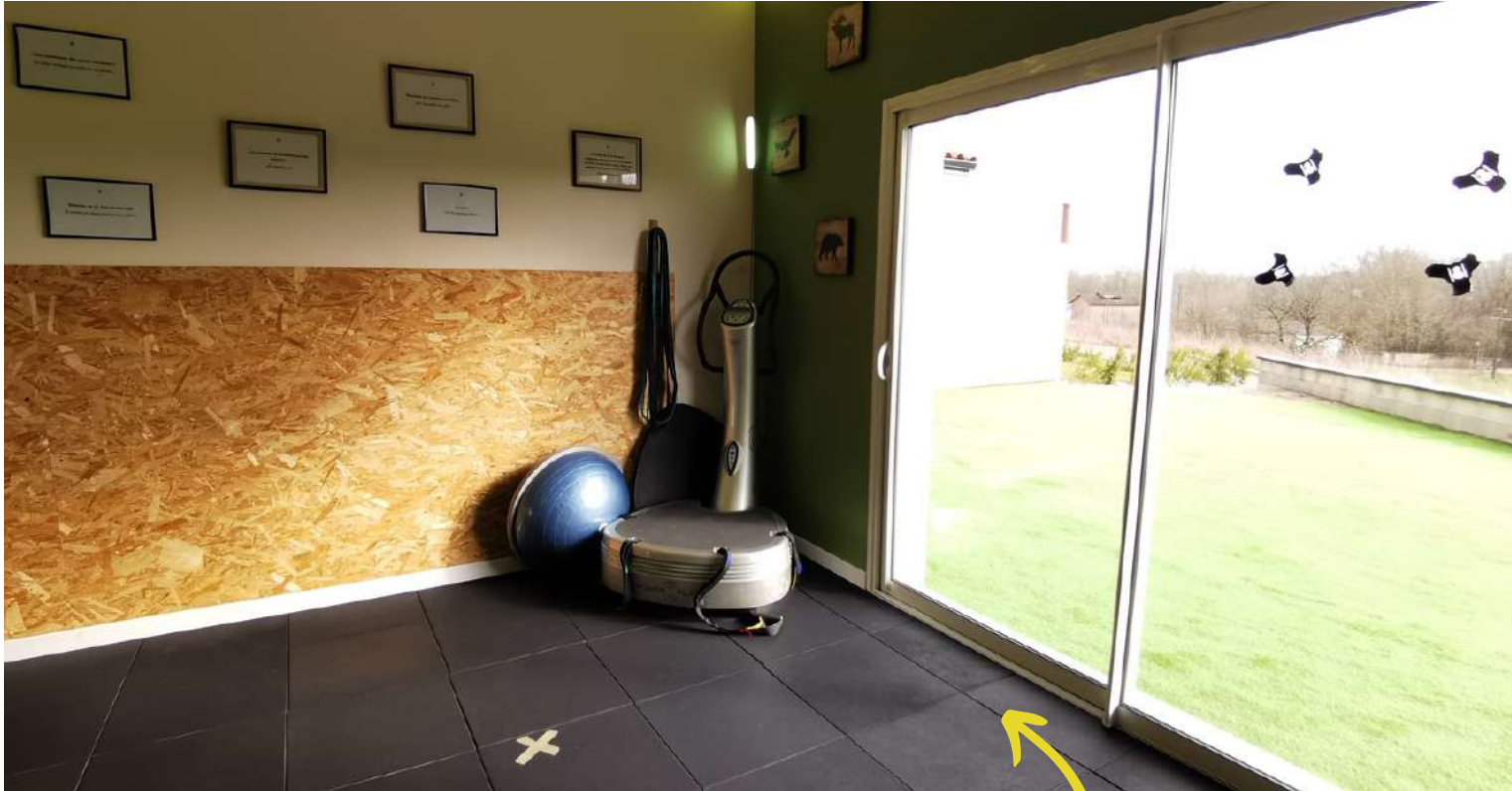
SALLE VERTE TONIFICATION & RENFORCEMENT